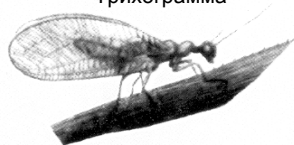
Олтинкўз ( Chrysopa carnea steph. )