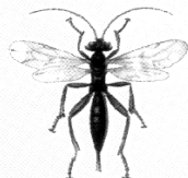
Яйдоқчилар ( Ichneumonidae ) Наездники