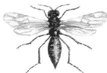
Бракон хебетор ( Bracon hebetor Say )