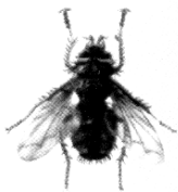
Тахин пашшаси ( Gonia ciliipeda Rid. )