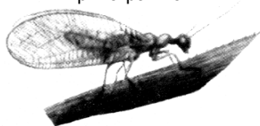
Олтинқўз ( Chrysopa carnea steph. )