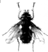
Тахин пашшаси ( Gonia ciliipeda Rid. )