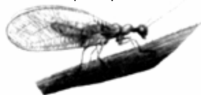
Олтинқўз ( Chrysopa carnea steph. )