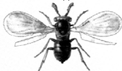
Трихограмма туҳумқўри ( Trichogramma evanescens )