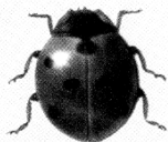
Етти нуқтали хон қизи ( Coccinella septempunctata L. )